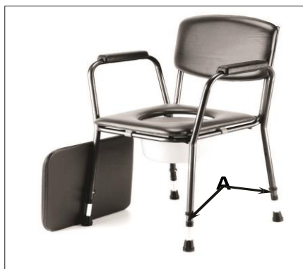
Umístění aretačních pojistek